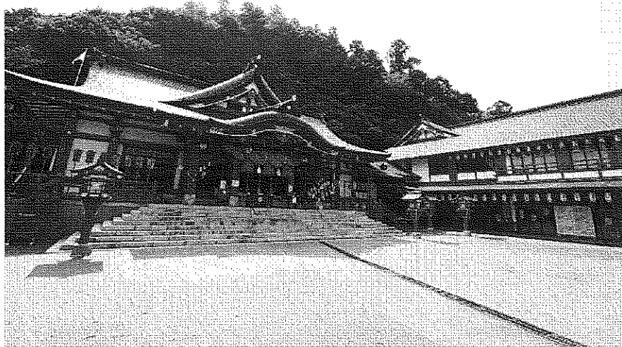
(津和野町：太鼓谷稲成神社)