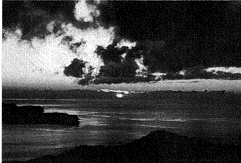
(知夫村：知夫からの景色)