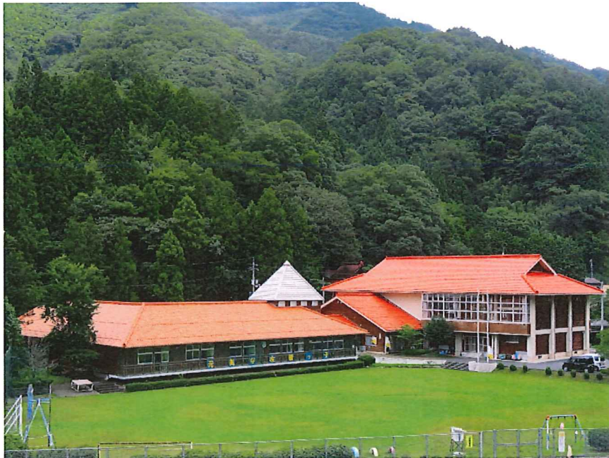
(津和野町:映画「高津川」のロケ地となった旧左鏡小学校)

「令和5年度予算編成及び施策」並びに「新型コロナウイルス感染症対策及び経済対策等」 に関する要望