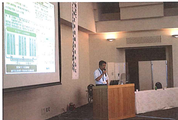
島根県中山間地域・離島振興課 井上GIによる行政説明