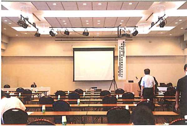
研修会場 40名:WEB参加 41名 参加