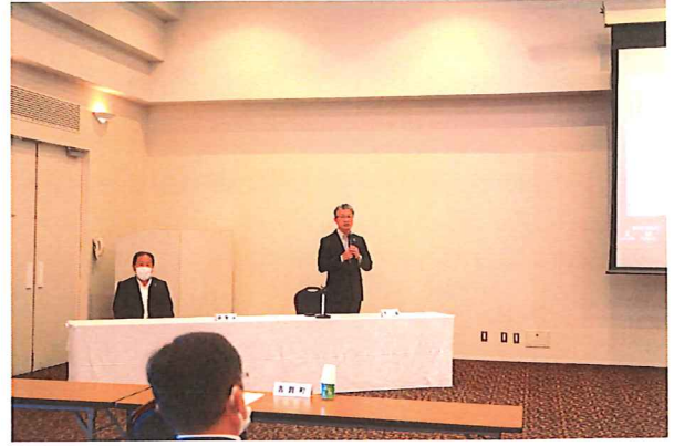
岩本会長あいさつ